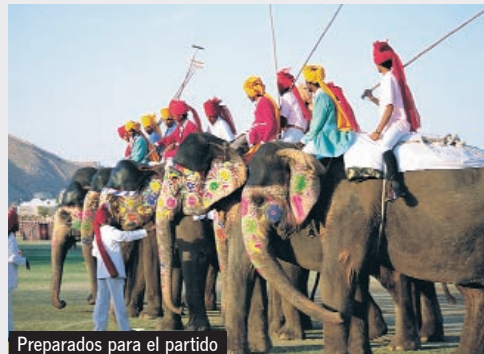
Preparados para el partido

A primera hora de la madrugada, salida en vuelo de regreso a España, vía una ciudad europea. Llegada.